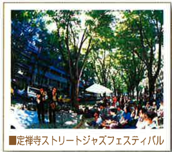
■定禅寺ストリートジャズフェスティバル