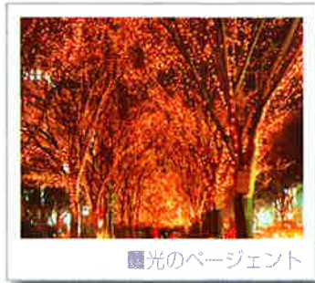
■光のページェント