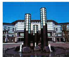
▲仙台国際センター